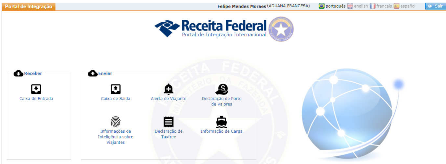
Figura 2- tela de menu de usuário estrangeiro no Portal Internacional de Alertas da RFB

Após o acesso o usuário tem a sua disposição os menus que permitem verificar as informações que foram enviadas pela Receita Federal assim como enviar informações categorizadas para a RFB que podem ser distribuídas entre alertas de viajantes; declaração de porte de valores; informações de inteligência; declaração “taxfree” e informações de carga.