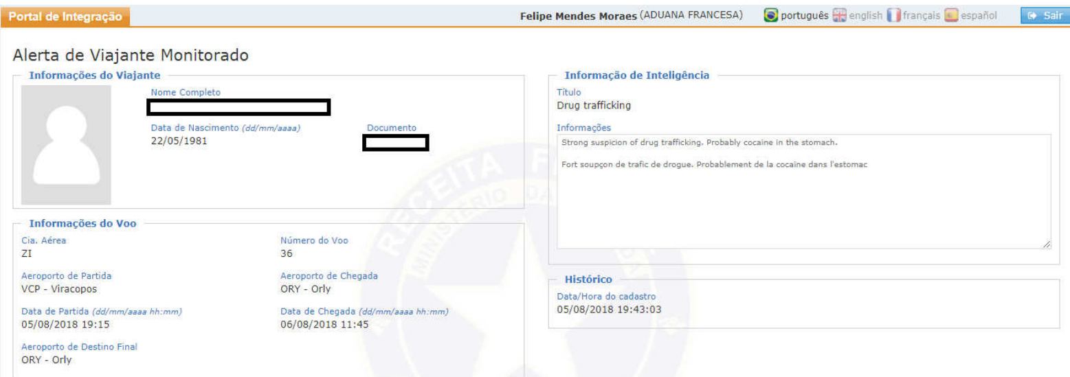
Figura 5- exibição alerta de risco de eventual “mula” do tráfico rumo ao aeroporto de Orly