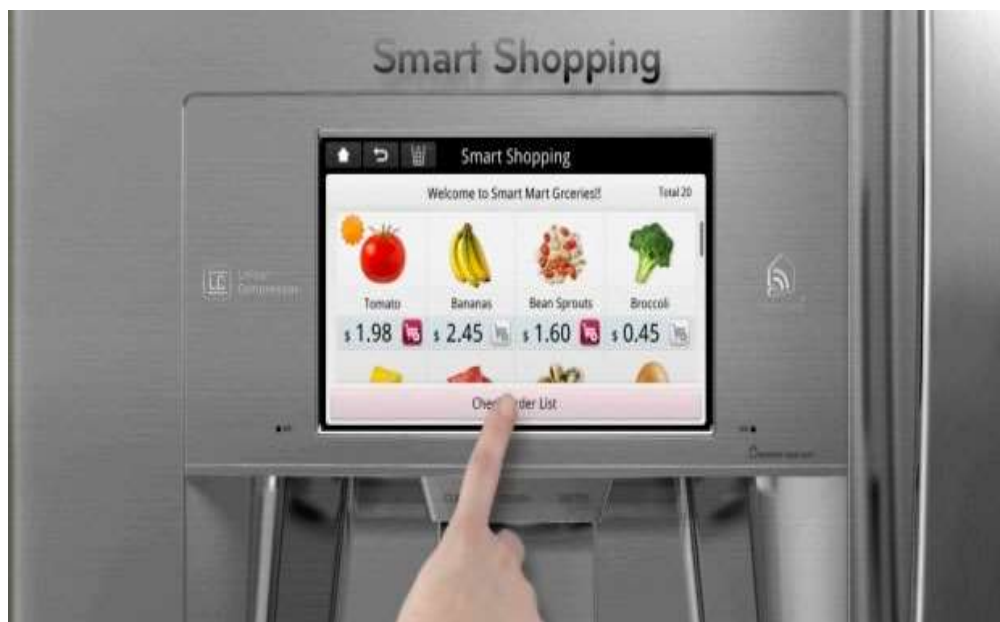
no consumo doméstico