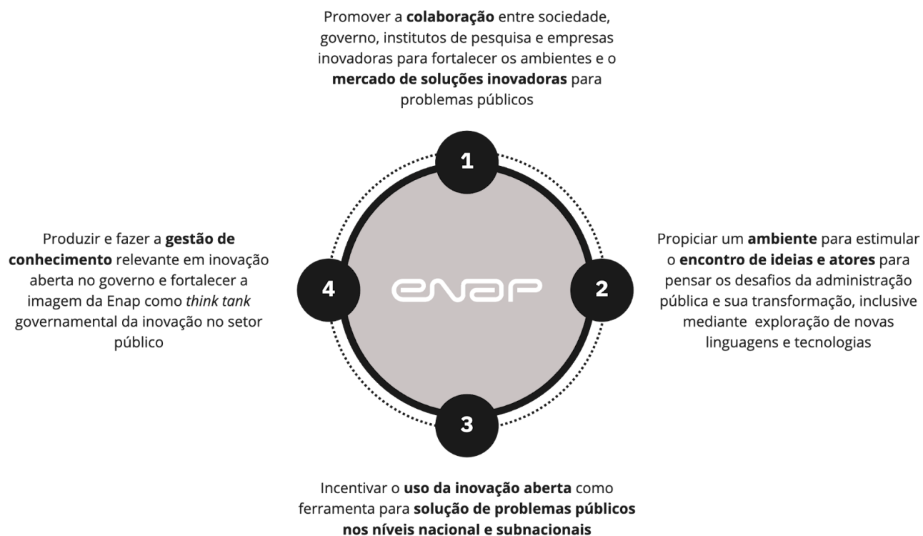
Figura 2. Objetivos da Estratégia de Inovação Aberta da Enap.

A seguir, é possível conferir o detalhamento das linhas de ação, suas metas e indicadores.