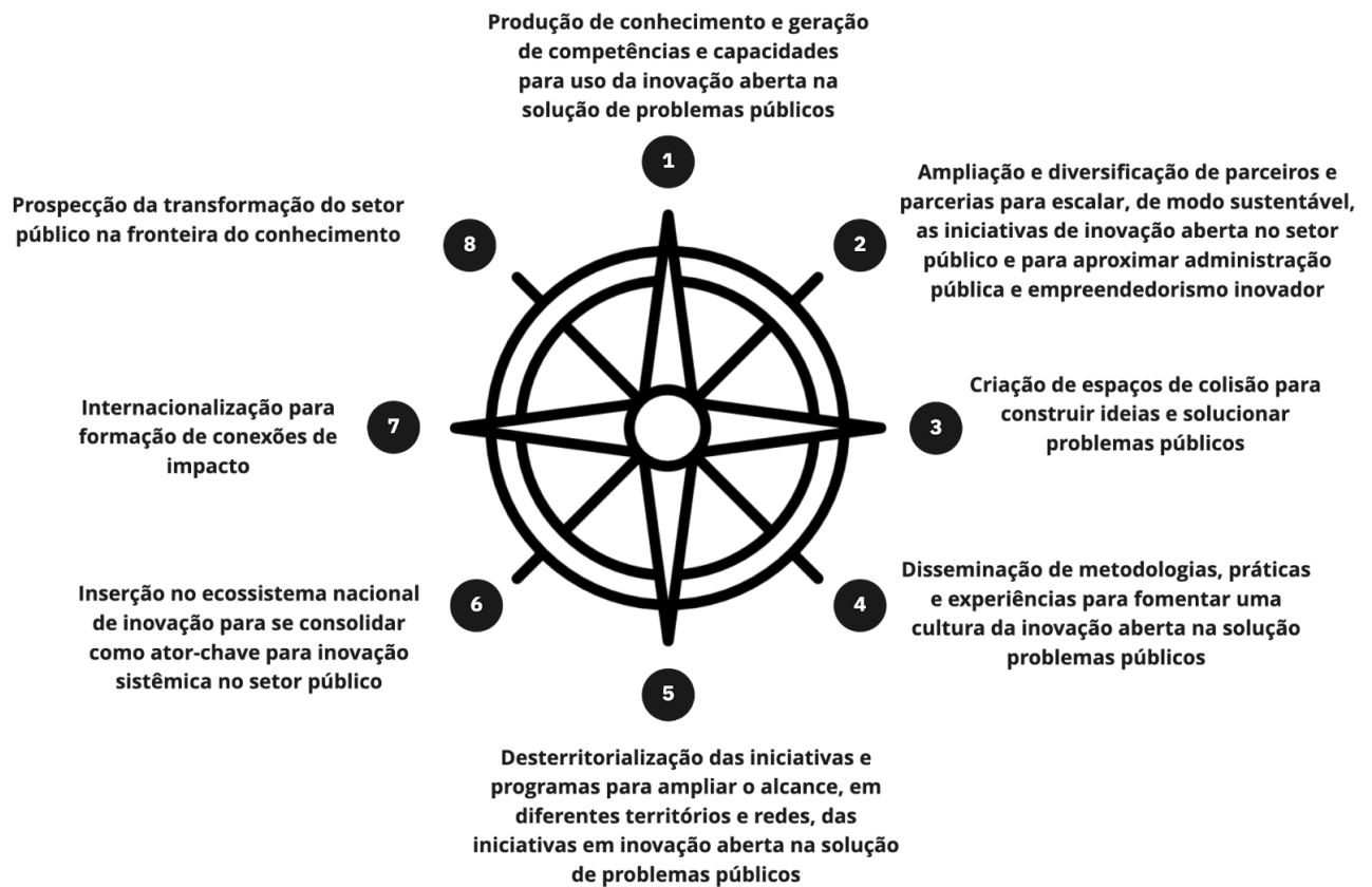
Figura 1. Diretrizes da Estratégia de Inovação Aberta da Enap.

As oito diretrizes podem ser assim compreendidas: