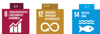
Figura 2: ODS e suas metas onde o turismo é citado explicitamente

Cumprir destacar que a meta 14.7 não se aplica ao Brasil, pois é direcionada a pequenos Estados insulares em desenvolvimento e a países menos desenvolvidos, que são os LDC (sigla em inglês para países menos desenvolvidos como os países da África Subsaariana e do Sudeste Asiático). Na classificação atual o Brasil é ‘país em desenvolvimento’. No entanto, as atividades associadas ao turismo devem contribuir para a gestão sustentável dos recursos marinhos.