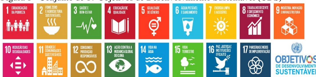
Figura 1 - Conjunto de 17 Objetivos de Desenvolvimento Sustentável (ODS)

Lançada na sede da ONU (Nova York) em setembro de 2015, a Agenda 2030 para o Desenvolvimento Sustentável (UNITED NATIONS, 2015) consiste em um plano de ação com o intuito de erradicar a pobreza, proteger o planeta e garantir que as pessoas alcancem a paz e a prosperidade. Construída de forma compartilhada com a participação dos Estados Membros, sociedade civil, academia e organizações internacionais, possui 17 Objetivos de Desenvolvimento Sustentável (ODS), 169 metas e 231 indicadores (UNITED NATIONS, 2020). Tal proposta possui como princípio de que os países, ao assinarem o documento, se comprometam com a adoção de medidas efetivas que promovam o desenvolvimento sustentável, sem deixar ninguém para trás, até 2030.