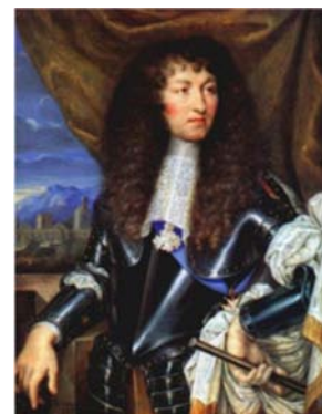
Luís XIV de Bourbon

Nos primórdios, o Estado moderno será marcado pelas formas absolutistas de poder, em que a figura do monarca se confunde com o próprio Estado. O folclore consagrou como exemplo, nesse sentido, o rei francês Luís XIV de Bourbon (1638-1715), que teria afirmado em algum momento: “L’etat c’est moi”. Contudo, em