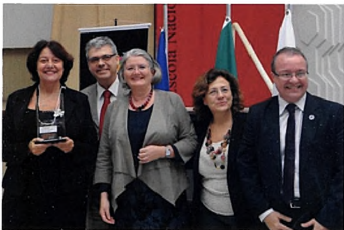
Equipe do Ministério da Saúde recebe o prêmio da Embaixadora da Noruega no Brasil, Aud Marit Wiig.

Além da publicação impressa, a Enap divulga as ações premiadas no Banco de Soluções disponível no site do Concurso Inovação: http://inovacao.enap.gov.br .