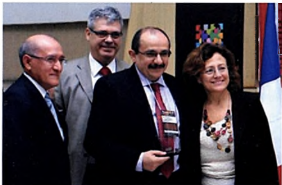
Representantes da Eletronorte recebem o troféu do 18º Concurso Inovação.