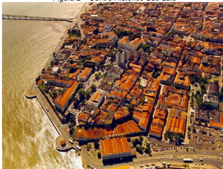
Figura 2 – Centro Histórico São Luís

imóveis ociosos e degradados para uso habitacional. Com todos esses projetos concretizados serão preservadas a identidade cultural e a rica história de São Luís, protegendo-a assim para futuras gerações.