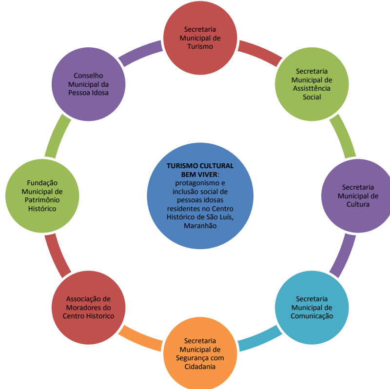
Figura 7 – Fluxograma Institucional

Assistência Social, de Cultura, de Comunicação, a Fundação de Patrimônio, a Associação de Moradores do Centro Histórico e Conselho de Pessoas Idosas.