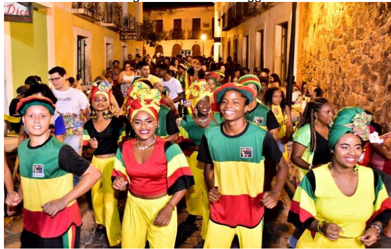
Figura 5 – Roteiro Reggae