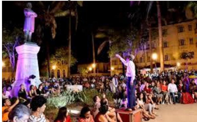
Figura 4 – Sarau Histórico

Com essas iniciativas, a Prefeitura vem realizando muitas atividades culturais na área do Centro Histórico, dentre elas o Programa Reviva, que objetiva movimentar as áreas recuperadas e garantir uma programação de lazer para ludovicenses e turistas que visitam o Centro Histórico da capital. A iniciativa integra as ações de revitalização e ocupação da área. O programa inclui atrações como o Sarau Histórico, Feirinha da cidade, Arte na Praça, Roteiro Reggae e o Passeio Serenata, essas ações são realizadas por artistas da cidade, cadastradas nas secretarias que desenvolvem as referidas atividades.