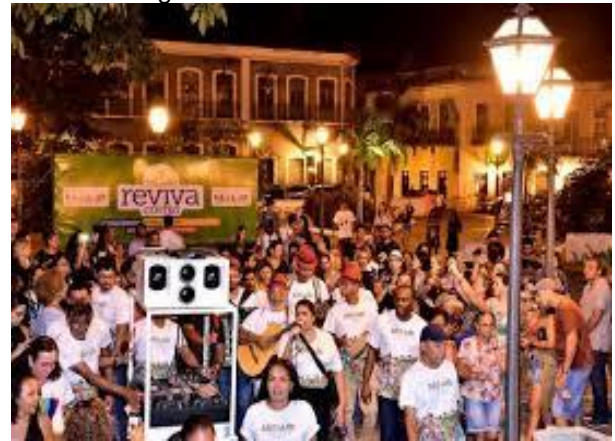
Figura 7 – Passeio Serenata