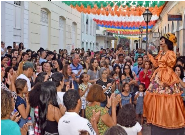
Figura 6 – Passeio Serenata