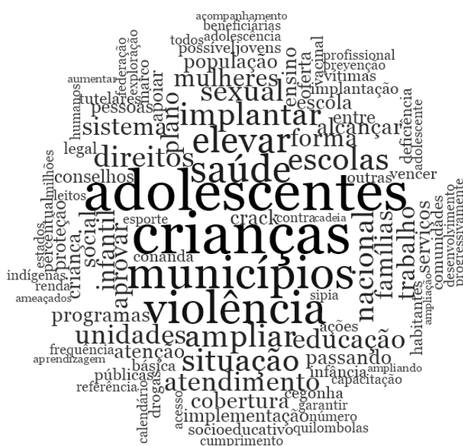
Figura 2. Nuvem de palavras das metas dos Objetivos do PPA 2012-2015. (Agenda Transversal Criança e Adolescente).

A figura 2 mostra um diagrama com as palavras que aparecem com maior frequência nas metas dos Objetivos do PPA 2012-2015 para a Agenda Transversal Criança e Adolescente: