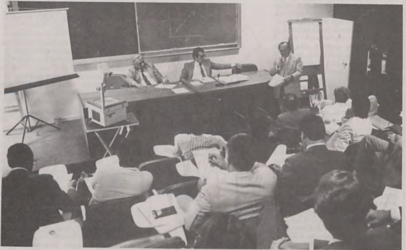
As reuniões do seminário da SEDAP chegaram a ter 300 participantes.