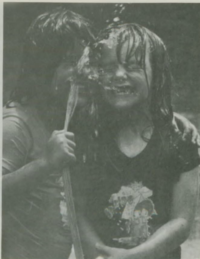
Menção Honrosa — Foto Colorida Título: Água é Vida — Fotógrafo: Diogenes Borges Cardoso.