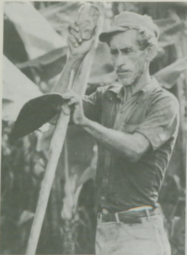
Menção Honrosa — Foto Preto e Branco Título Agricultor de Subsistência