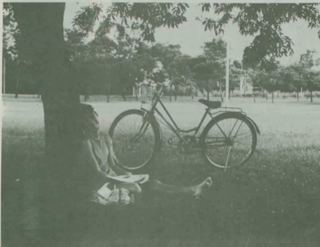
1.º Lugar — Foto Preto e Branco Título: Descontração