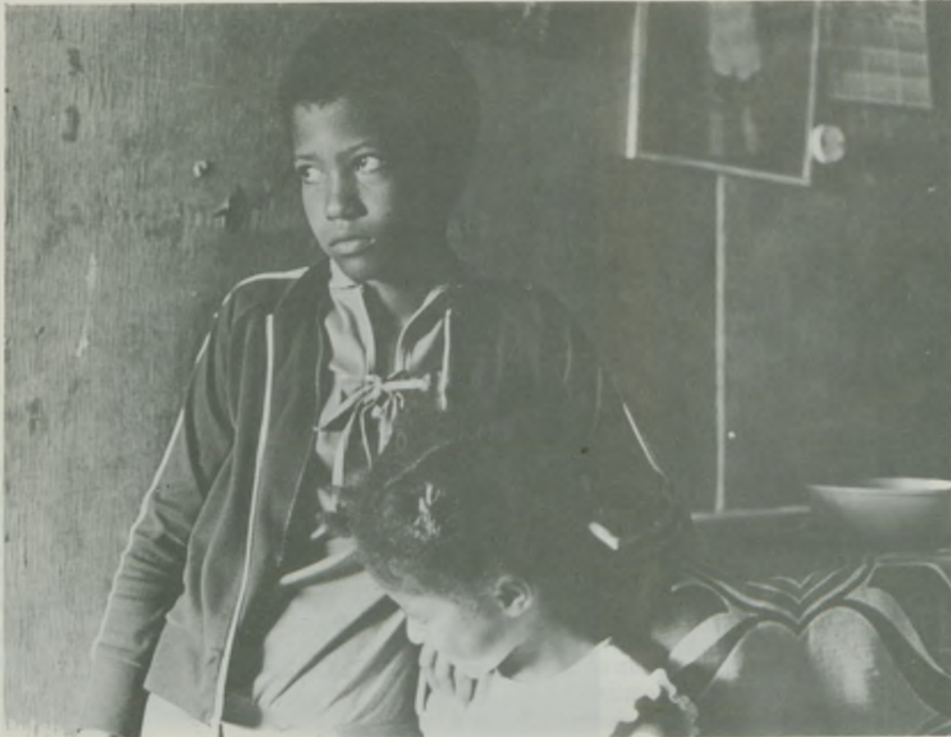
Menção: Honrosa — Foto Preto e Branco Título: Futuro