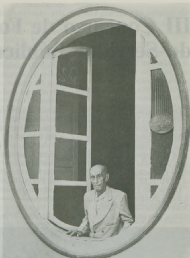
2.º Lugar — Foto Preto e Branco Título: Moldura Fotógrafa: Cidinha Coutinho.