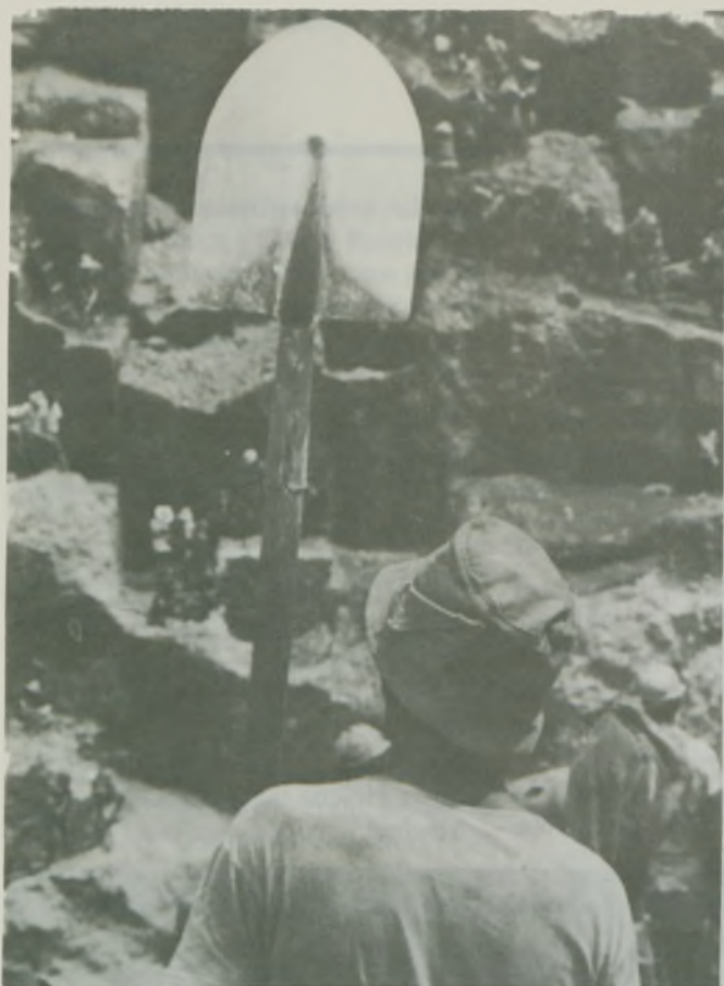
2.º Lugar — Foto Colorida Título: A Força do Garimpeiro