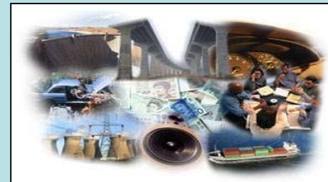
Estímulo à Inovação