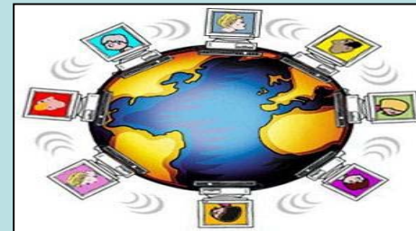
Comunidade de Prat.