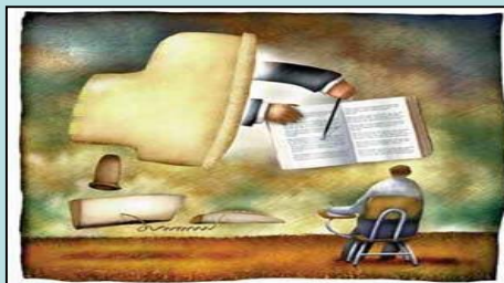
Educação à Distância