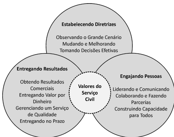
Figura 2: Construto de Competências do Civil Service no Reino Unido